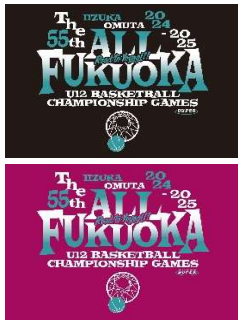
*Tシャツ・ロングTシャツサイズ目安表